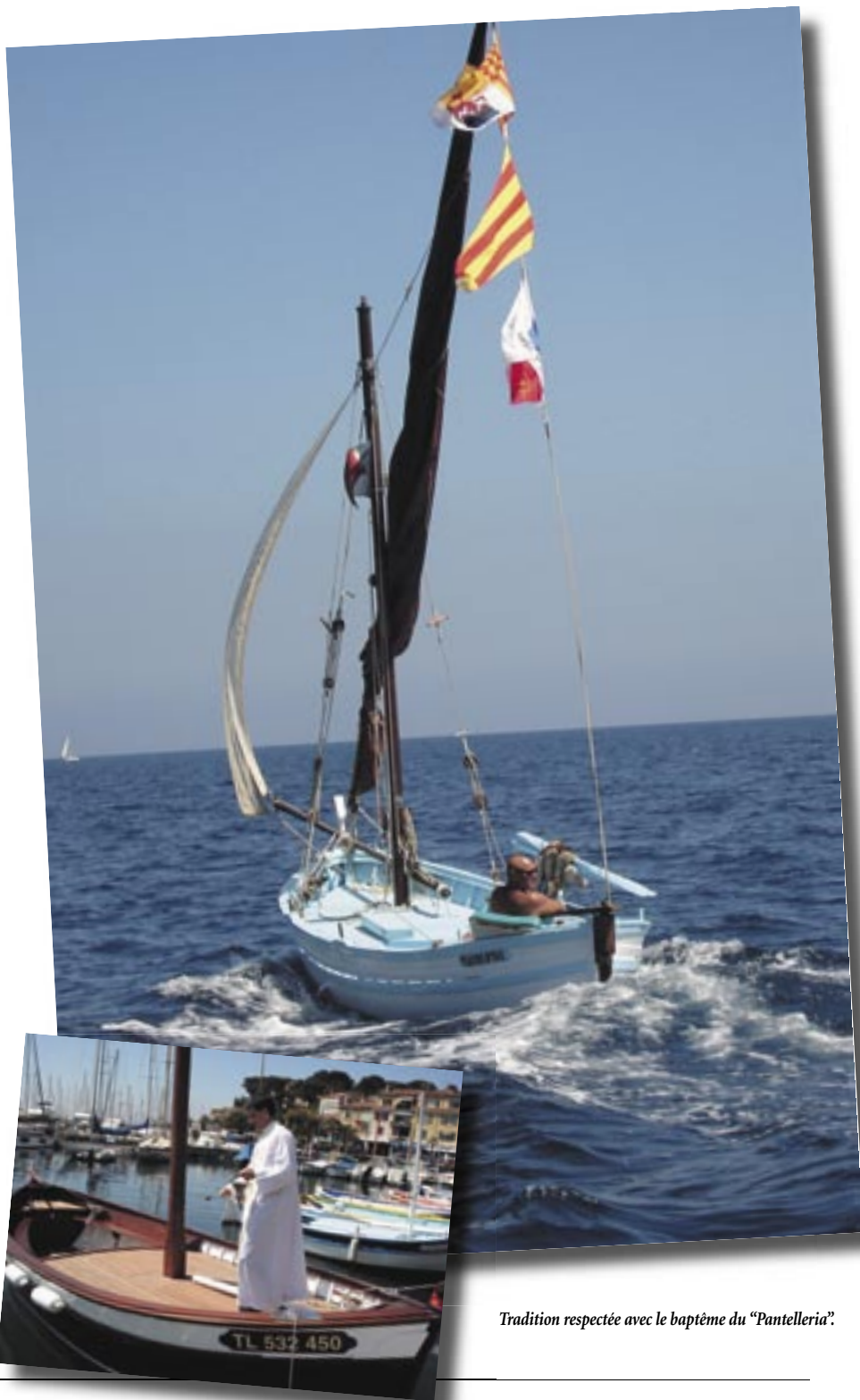
Tradition respectée avec le baptême du "Pantelleria".

Pour en savoir plus, visitez le site Internet : www.lespointusdesanary.fr